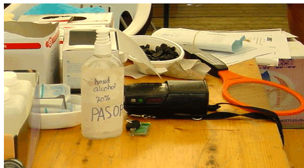
boven ziet u op de achtergrond de genomen monsters, dropjes en handenontsmettingsalcohol

Op de ochtend van 4 augustus was het aantal zieken gestegen tot 169. Tijdens de laatste dag en nacht van het evenement nam het aantal zieken fors toe en werden 37 patiënten in het ziekenhuis opgenomen. De ochtend van 5 augustus vertrok het merendeel van de deelnemers. Zieke buitenlanders en een deel van de medewerkers bleven op het terrein achter. Er ontstond een discussie tussen de diverse hulpverleners en instanties, en de gemeente over de tijdelijke opvang van de vele zieken (voornamelijk buitenlanders) die niet konden reizen omdat ze te ziek waren en het mogelijke risico op verdere verspreiding door zieke reizigers. Het was geen optie om deze personen langer op het terrein achter te laten omdat de opbouw voor het volgende evenement (meer dan 10.000 deelnemers) al plaatsvond. Het moest voorkomen worden dat zieke padvinders de toiletten of de opbouwmedewerkers van het nieuwe evenement zouden besmetten. Dit zou anders het begin kunnen zijn van een nieuwe uitbraak. Verschillende noodoplossingen, zoals de installatie van een zorgmeldpunt, passeerden de revue maar uiteindelijk loste het probleem zich vanzelf op doordat zieken toch afreisden. Er zijn geen meldingen gekomen van gastro-enteritis tijdens het nieuwe evenement.