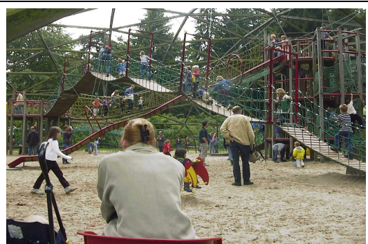
Dat speeltoestellen steeds groter worden, brengt ook steeds meer gevaren op beknelling, verstikking, valgevaar etc. met zich mee.

Ook op het gebied van de legionella stonden de NF-controleurs niet stil. Na het grote alarm op de Friese Flora, waarbij vele slachtoffers vielen, bleken ook de nodige andere openbare gelegenheden, sportkantine en campings voor verontrusting te zorgen. Legionella was ook daar mogelijk.