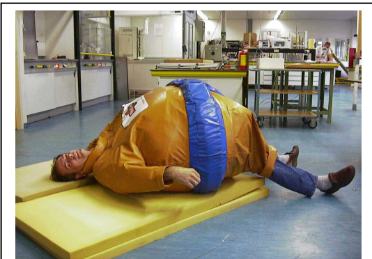
Het testen van "sumo-pakken" n.a.v. een ongeval, behoort ook tot de werkzaamheden van een Non-food controleur.

Dat er inmiddels, zo'n kleine twee jaar na de reorganisatie meer werk op het Non-food terrein lag dan men aanvankelijk had bedacht, kon niet uitblijven. Hieronder een greep van wat in regio Noord-West bij het Non-food team zoal ter tafel kwam het laatste jaar.