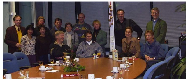
Dat niet alleen de collega's het met elkaar goed konden vinden, maar ook de aanhang, bleek tijdens het openingsfeestje van het nieuwe dienstgebouw in Amsterdam dat op deze afdeling werd gegeven.

Erger was de melding dat een kindje van ca. twee jaar zichzelf had opgehangen doordat het koortje van zijn jasje tussen de naden van een glijbaan was blijven steken. De glijbaan bleek een zelfbouw pakket hetgeen niet onder het Besluit veiligheid speeltoestellen valt. Via dit Besluit worden namelijk specifieke normen genoemd die dit geval van verstikkingsgevaar voorkomen. Vaders opletten dus met zelfbouw speeltoestellen voor kinderen!